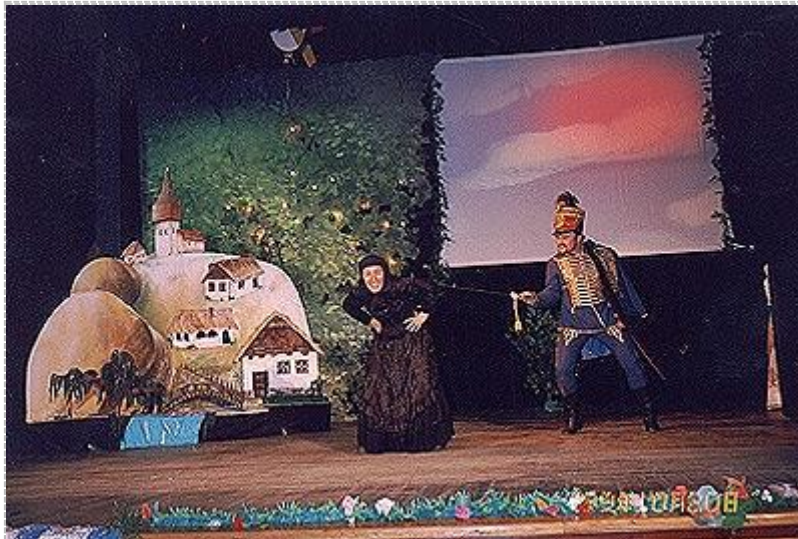
János vitéz az Operetthajón