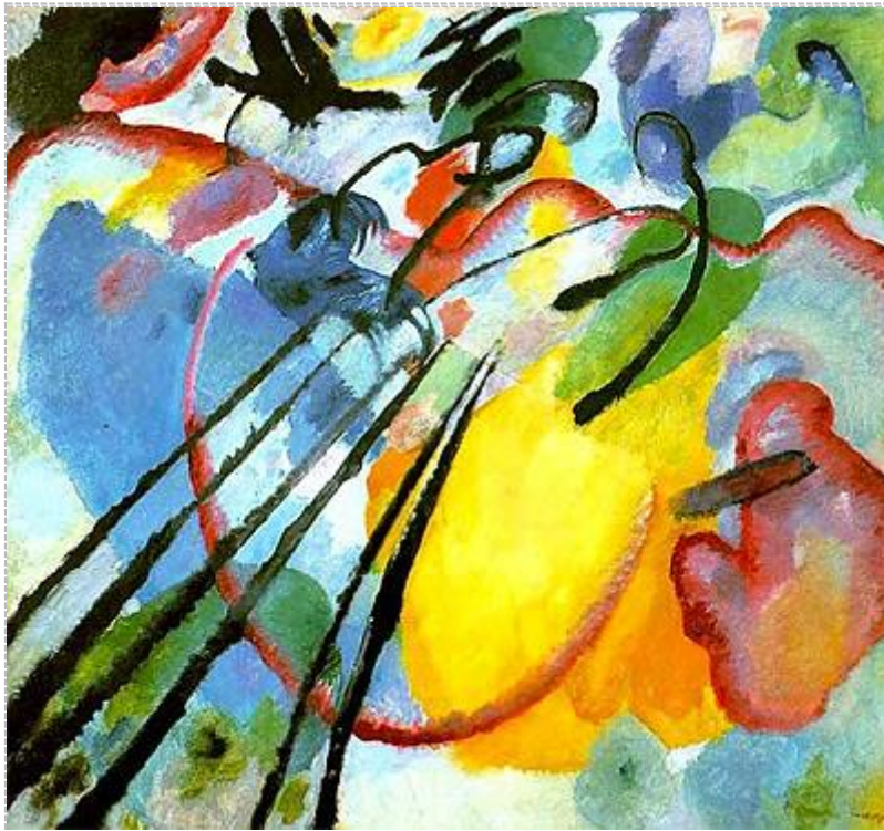
Kandinszkij: Improvizáció 26.

Trotz seines Glaubens ist das keine kosmische Sehweise, sondern es sind spukende Geister und kosmisches „Abfallverstreuen“. Sieh, alles zerfällt und darunter verzehren wir die Erde. Bei diesen Prozessen fragt man mit Recht: was wird unseren Nachfahren geschehen? Was wird von all dem bleiben? Und was erhalten bleibt, was werden wir damit anfangen? Es wird nämlich keinerlei geistige Marshall-Hilfe vorhanden sein, auf deren Grundlage man wieder etwas fundamental Würdiges, etwas wirklich Großartiges aufbauen könnte.