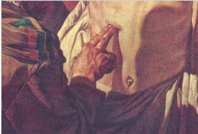
Gerard van Honthorst: Hitetlen Tamás (részlet)