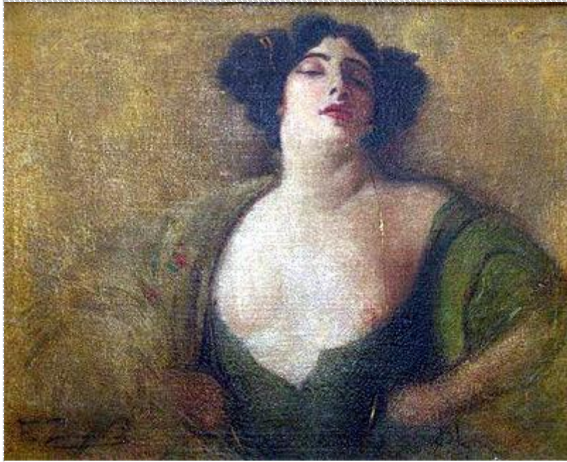
Franciszekr Żmurko: Hetera

Also ein Freudenmädchen kann nicht wegen unmoralischem Verhalten verurteilt werden. Höchstens diejenigen, die sie dazu zwingen, oder die ihren Zustand aufrechterhalten.