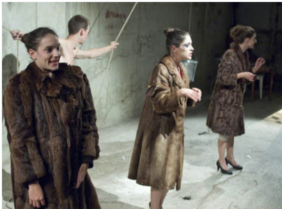
Jelenet az előadásból

- Szöveges részek lesznek az előadásban?