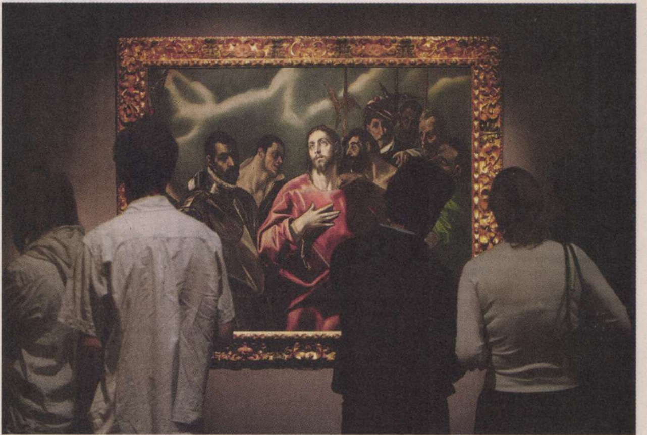
A Nemes Marcell gyűjtötte El Greco-képek is láthatók a Szépművészeti Múzeumban

A gyűjtő váratlan halála után 1931-ben, majd 1933-ban Münchenben rendeztek árveréseket.