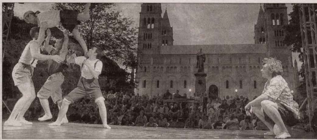
A barátságos hangulat még kitart. A hét második felében is gazdag programokkal várják a nézőket