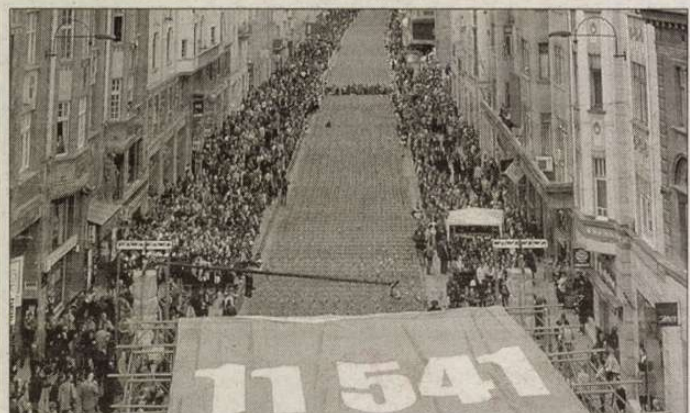
Szarajevó néma főhajtsa a háború áldozatai előtt

„Ideadták a trikóját meg a melegítőfelsőjét. Amikor betemették, ez a melegítő kék volt. Attól fogva azonban már nem kék volt, hanem rothadt. Ez