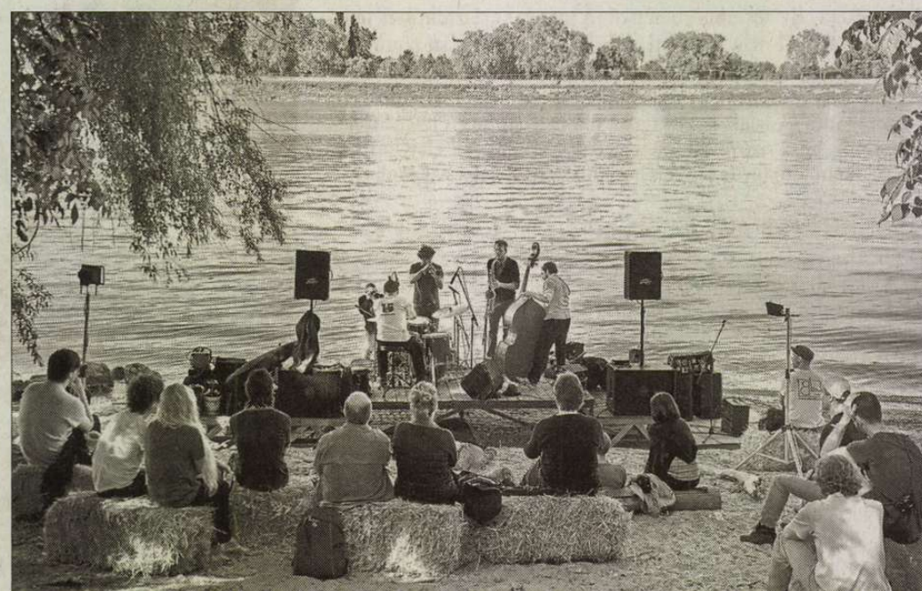
A Geröly Kwartett koncertje a Duna partján felállított színpadon

A zenei programokat négy csoportba sorolták a szervezők, úgy mint jazz/blues/improvizatív zene