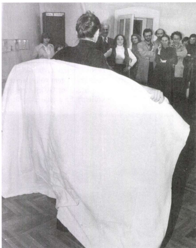
A szüzesség eldobása

nem engedett. A régi Mozgó Világban (1975–1983) sok fotó jelent meg Szabados György munkásságáról, de a lemez más volt. Népzene, kortárs zene, free jazz élt egyszerre és egymásban. Spontán volt és bonyolult, ami nagyon ritka, nem csak a zenében. Vonzódtam az aszimmetrikus ritmusvilághoz, egyre délebbre és egyre keletebbre nyújtottam csápjai-